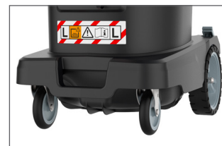
Roues extra-larges et roulettes pivotantes - adapté aux chantiers de construction