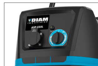
Sélecteur de puissance mode manuel ou automatique. Prise pour outils max. 2200 W