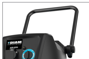
Poignée de poussée réglable et pliable pour un transport facile