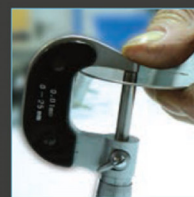
Mesure de l'épaisseur de la lame