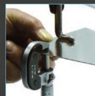
2 points de mesure à l'aide d'un micromètre