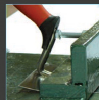
Test de résistance de la soudure