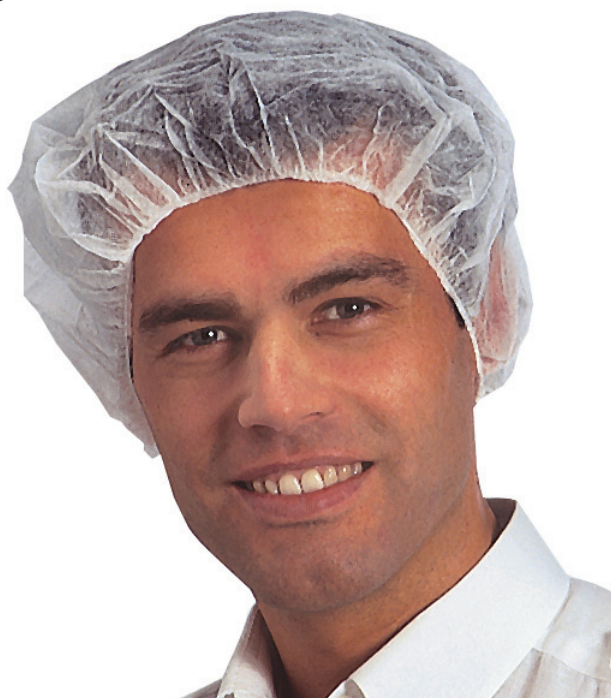
A: 53 cm (*)