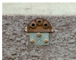
Plaques 3 trous ø 14 Buse ø 2,7