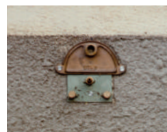
Plaques 1 trou ø 14 Buse courte ø 4