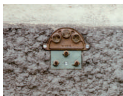
Plaques 3 trous ø 20 Buse longue ø 4