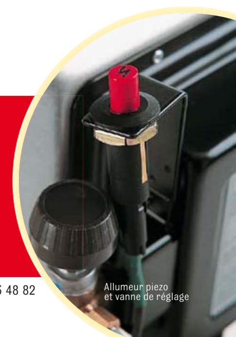
Allumeur piezo et vanne de réglage

SOLOR 4200 CA/B, 4200 CA/P et 8500 MCA : équipés d'un contrôle de flamme par thermocouple associé à un contrôleur d'atmosphère, ils s'utilisent en PLEIN AIR ou à l'INTERIEUR DES LOCAUX : • DOMESTIQUES : SOLOR 4200 CA/B, avec détendeur fixe butane • PROFESSIONNELS : SOLOR 4200 CA/P et 8500 MCA avec détendeur fixe propane (hors bungalows, magasins, ERP, restaurants...).